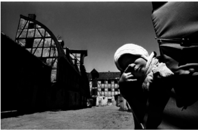
Romualdas Požerskis (g. 1951) Klaipėdos senamiestis II 1976/2009, sid. br. atsp., 35,7 x 49,4 950 Lt

kovo 23 d. (penktadienį) 18 val. galerijoje "Kunstkamera" (Ligoninės g. 4, Vilnius) įvyks XXII Vilniaus aukcionas. Aukcionui teikiamus kūrinius galima apžiūrėti aukciono ekspozicijoje, kuri veiks galerijoje "Kunstkamera" kovo 14-22 d.