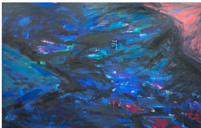
Rimvidas Jankauskas-Kampas (1957–1993), „Be pavadinimo“, 1991–1992, drb., al., 190 x 300