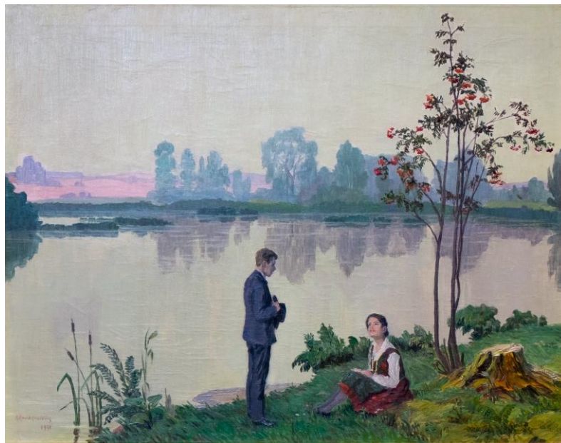
Antanas Žmuidzinavičius (1876–1966) Paežery. Atostogoms baigiantis (Atostogose) 1931, drb., al., 57,8 x 73,5

Nors visi kūriniai itin saviti, tarp jų itin išsiskiria A. Žmuidzinavičiaus darbas „Paežery. Atostogoms baigiantis“, kuris pagal autoriaus kūrinių registrą yra priklausęs Lietuvos ūkio banko Kretingos, Klaipėdos ir Vilniaus skyrių kūrėjui ir vadovui Petrui Končiui (1882–1950). 1937 m. darbas buvo eksponuotas apžvalginėje dailininko darbų parodoje Klaipėdoje.