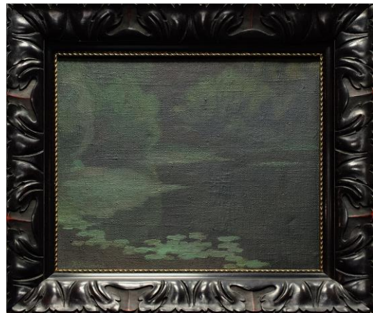
Kazimieras Stabrauskas | Vandens lelijos (XX a. 1 ketv.)