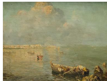
Giuseppe Giardiello (1887–1920, Italija) Vaizdas į Neapolio įlanką XIX a. pab.–XX a. pr., drb., al., 59 x 77

LIII Vilniaus aukcionas įvyks š. m. rugpjūčio 4 d. (šeštadienį) 19 val. Palangoje, A. Mončio namuose-muziejuje (S. Daukanto g. 16). Aukciono ekspoziciją galima apžiūrėti rugpjūčio 1–4 d. 13–19 val. ten pat.