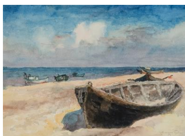
Jonas Buračas (1898–1977) Žvejų valtys pajūry, Palanga 1939, pop., akv., 24 x 33