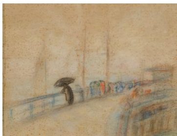
Vytautas Kairiūkštis (1890–1961) Ant Palangos tilto XX a. 4 d–metis, pop., piešt., past., 22,2 x 27,7