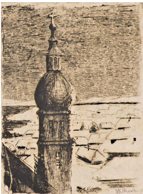
M. K. Čiurlionis, „Apsnigtas kaimas“